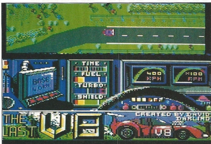
The Last V8